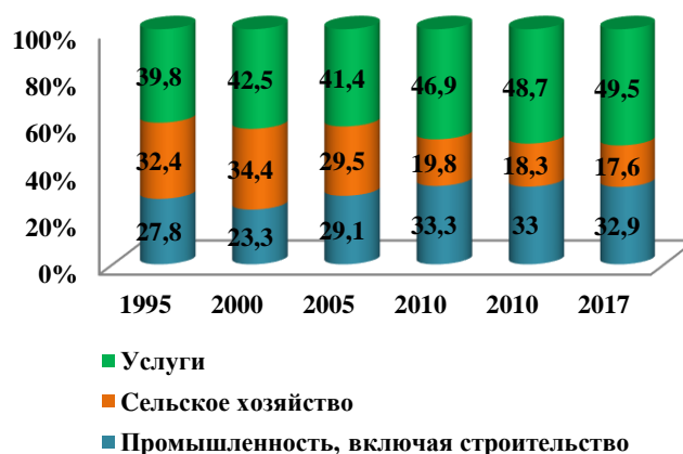
Рис. 1. Динамика изменения структуры ВВП (в %).

Внешнеторговый оборот, по оценке Государственного комитета по статистике Республики Узбекистан, продолжает увеличиваться. Внешнеторговый оборот Узбекистана за январь-декабрь 2017 года составил около $27 млрд. В 2017 году экспорт Узбекистана составил около $14 и импорт – $13,0 млрд или на долю экспорта приходился 52%, импорта – 48% (рис. 2) [9].